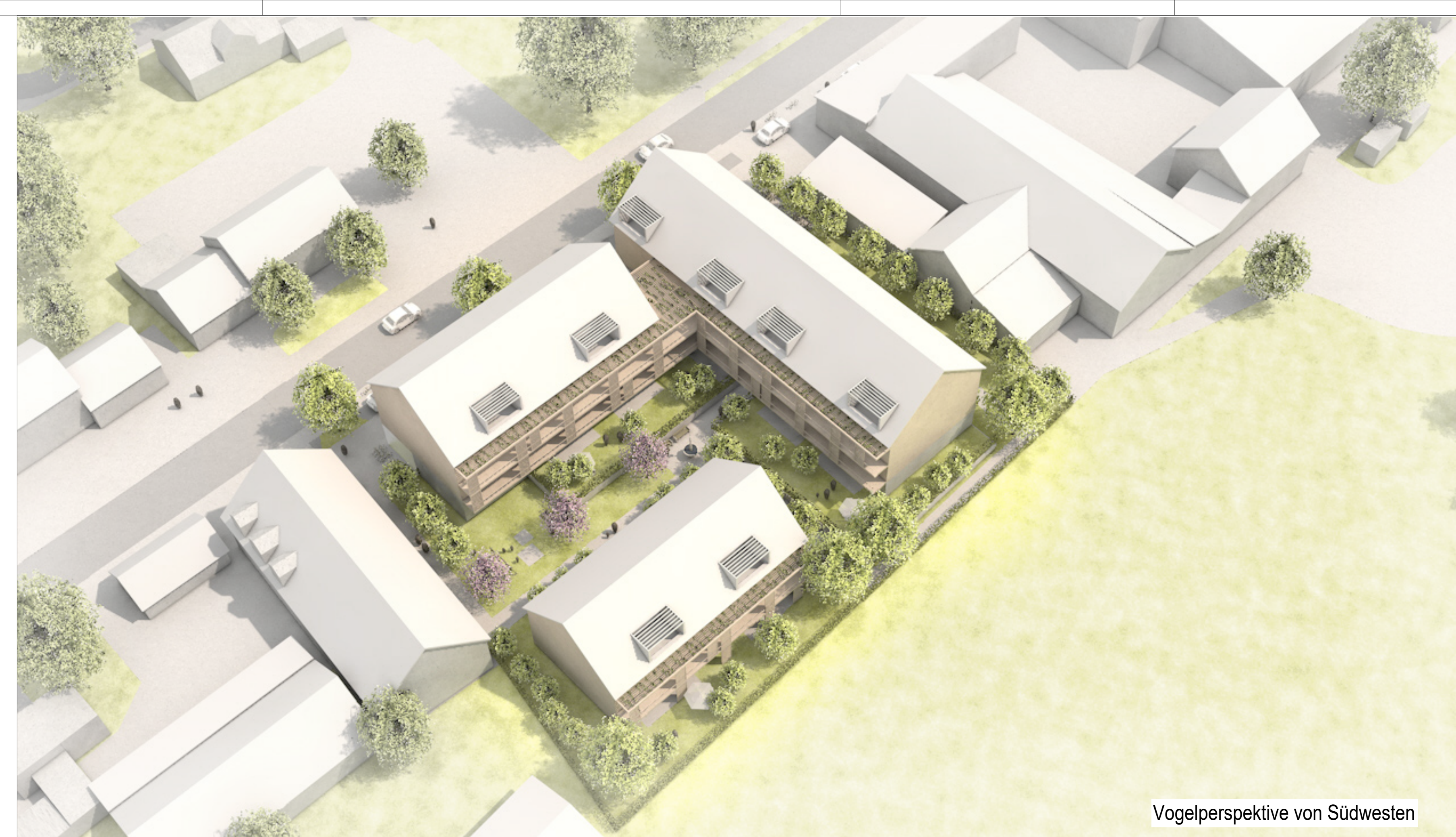
Vogelperspektive von Südwesten