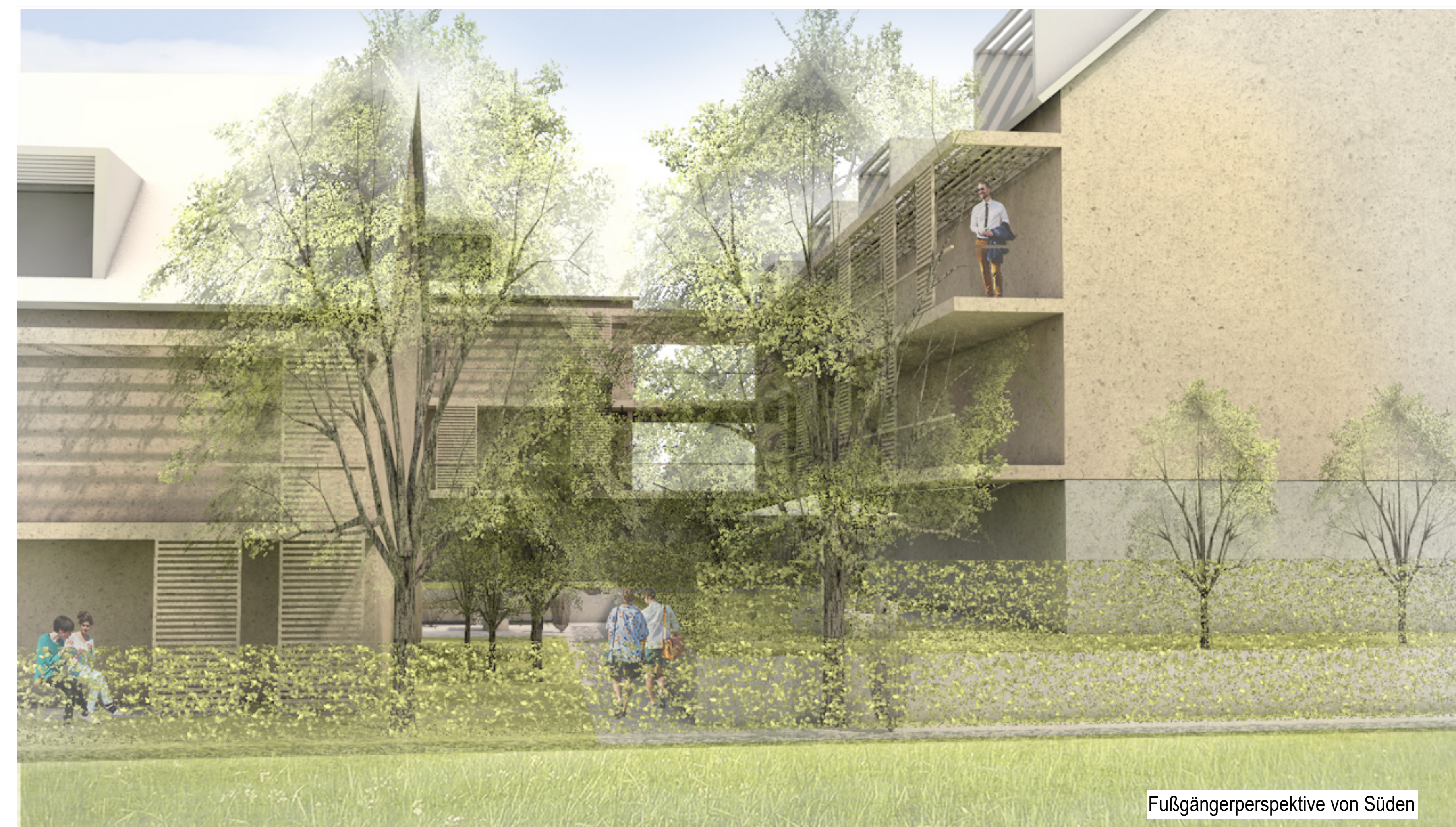
Fußgängerperspektive von Süden