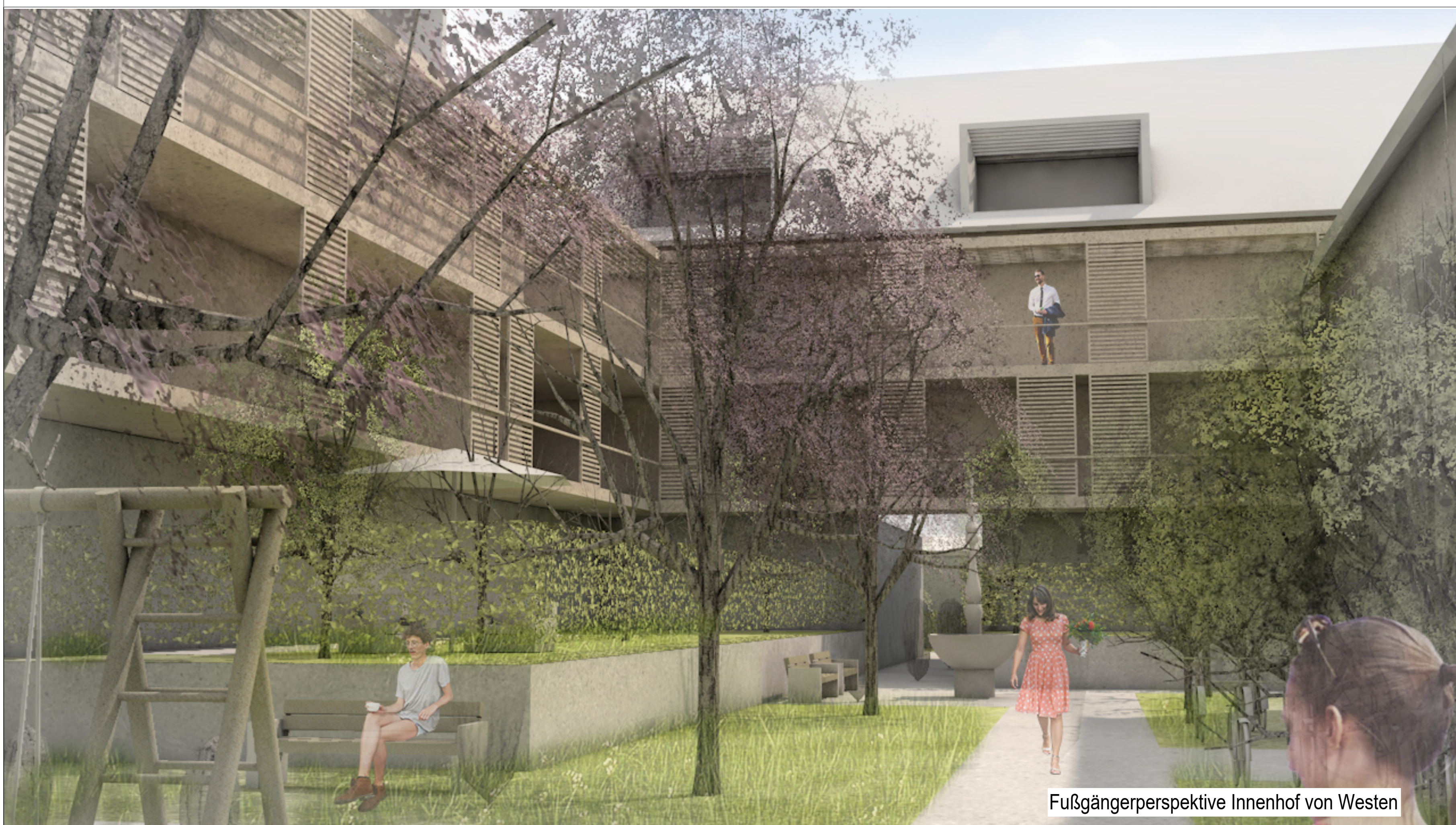
Fußgängerperspektive Innenhof von Westen