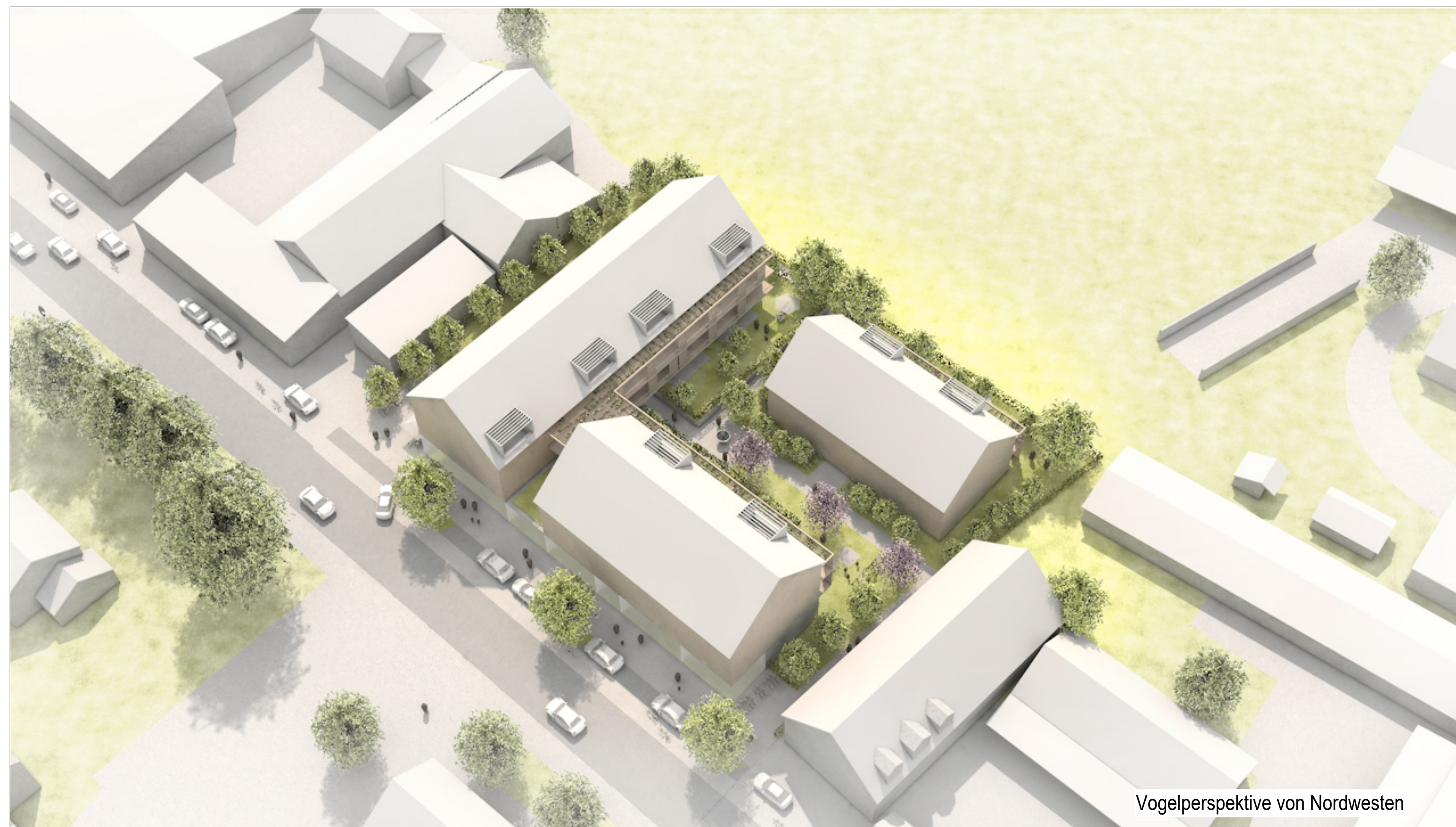
Vogelperspektive von Nordwesten