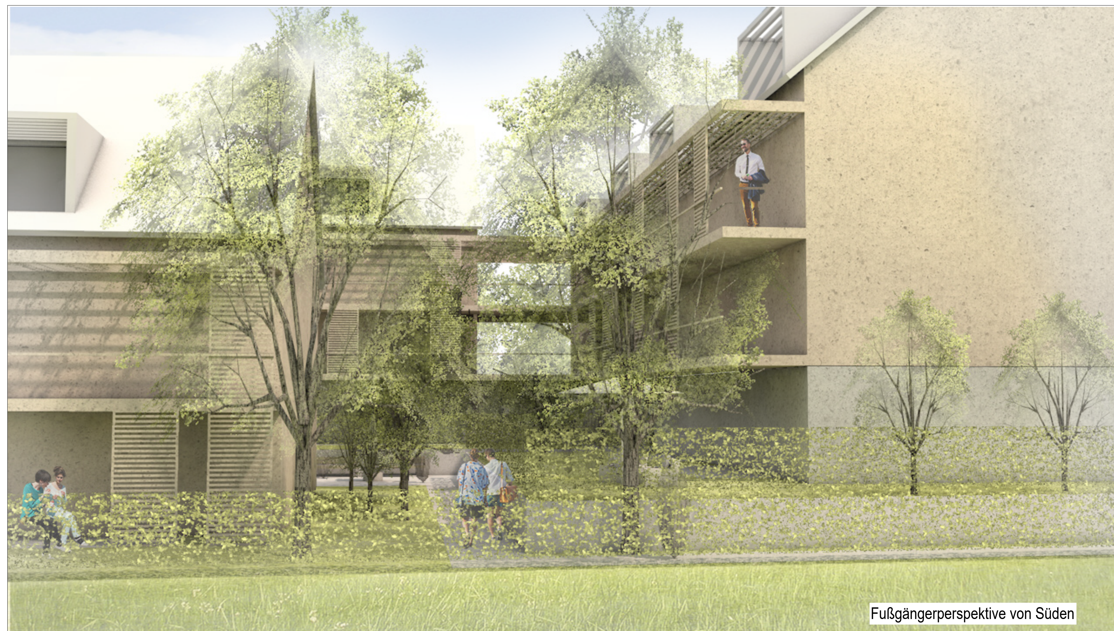
Fußgängerperspektive von Süden