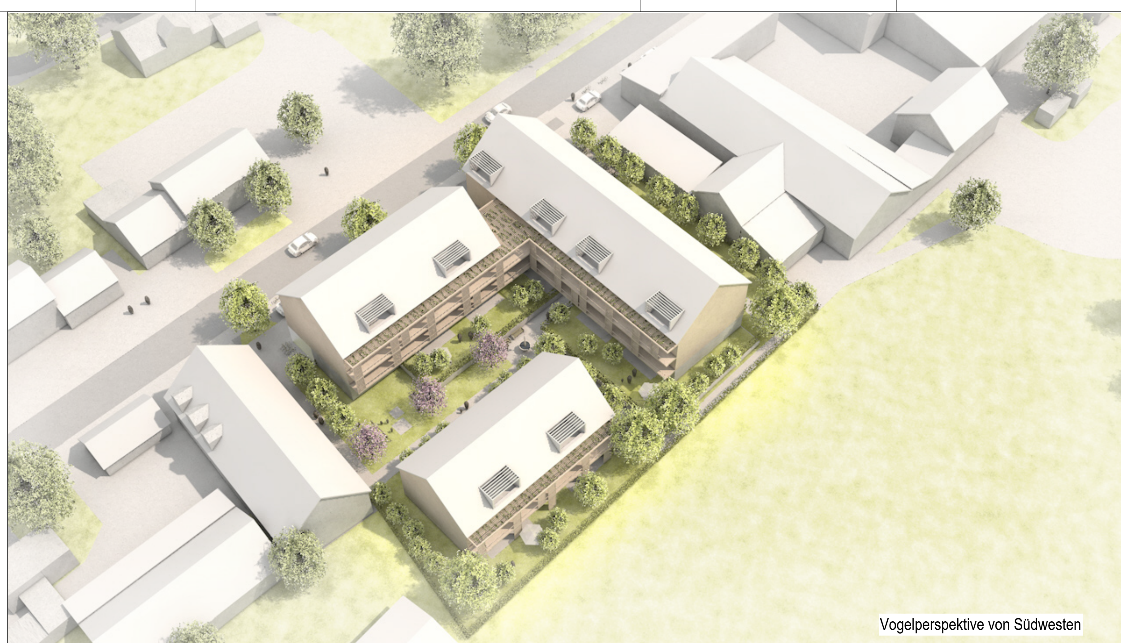
Vogelperspektive von Südwesten