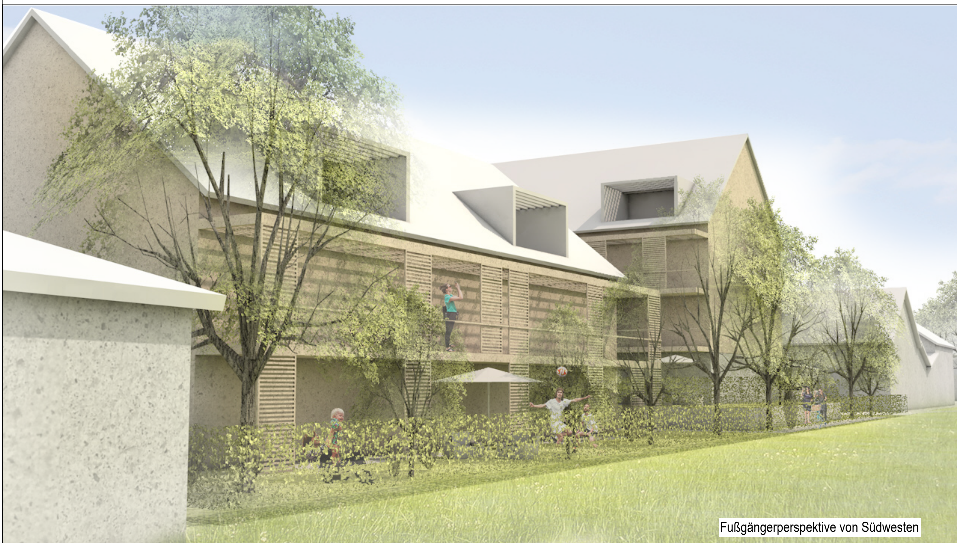
Fußgängerperspektive von Südwesten